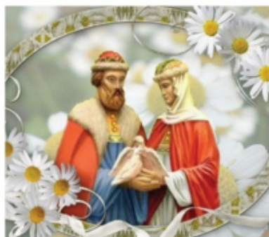
Молитва святым благоверным Петру и Февронии

На Московском соборе 1547 г. положено было местно прославить их. Впоследствии (вероятно с 1552 г.) это празднование стало повсеместным. Сегодня честные мощи святых покоятся в Свято-Троицком Новодевичьем монастыре в Муроме и совершают во славу Божию чудеса тем, кто с верой обращается к ним. В жизни своей они были образцом христианского супружества, готовые на все лишения для евангельской заповеди о нерушимом союзе. И ныне они молитвами своими низводят небесное благословение на вступающих в брак.